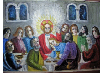
Innstiftelsen av nattverden-Skjærtorsdag