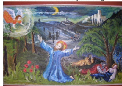
Jesus i bønn i Getsemane-Langfredag