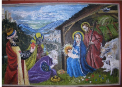
Jesu fødsel-de tre vise menn