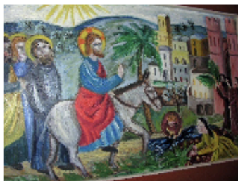
Inntoget i Jerusalem palmesøndag