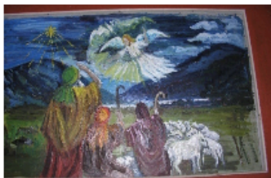
Englene på marken-hyrdene