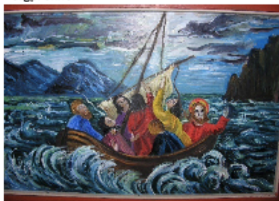
Jesus stiller stormen